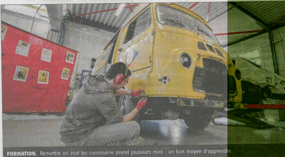
FORMATION. Remettre en état les carrosserie prend plusieurs mois : un bon moyen d'apprendre.

Le véhicule, prêté par un collectionneur, est entré dans les ateliers l'année dernière, et il devrait y rester encore quelques mois.